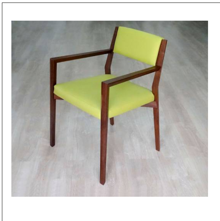
Legno massello di Noce Canaletto