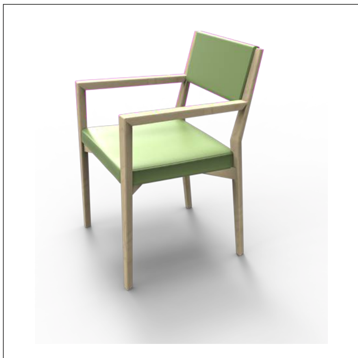
Legno massello di Acero