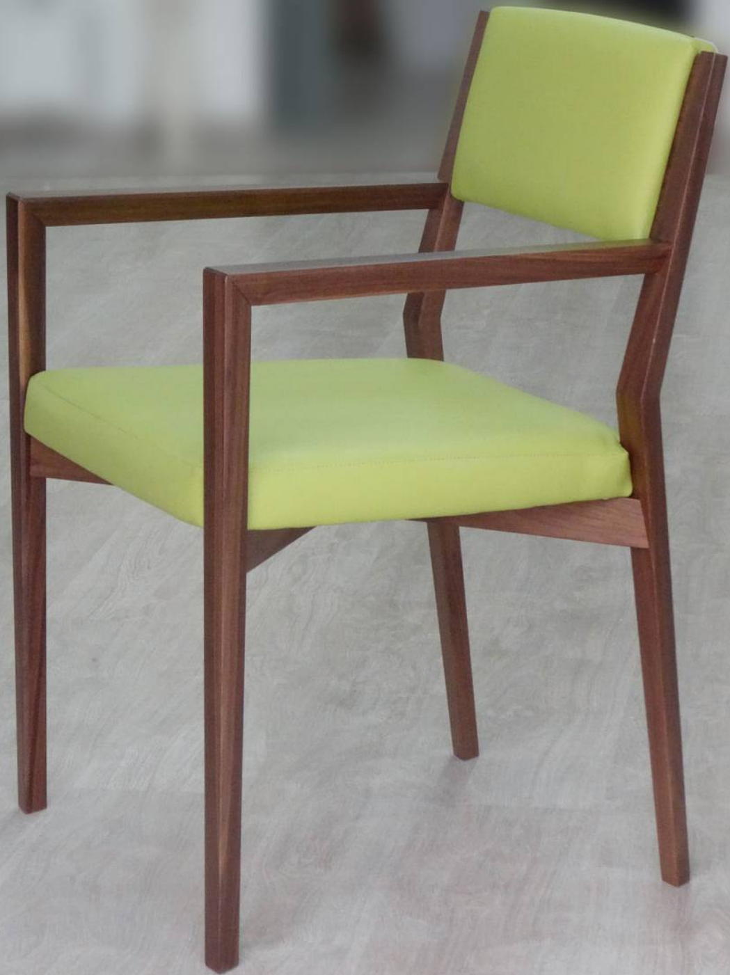
Sedia in legno massello di noce canaletto con rivestimento in eco-pelle verde mela.