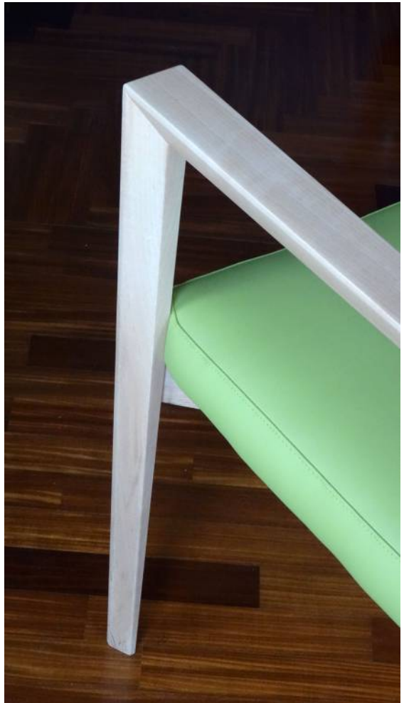
Particolare della sezione trapezoidale variabile.